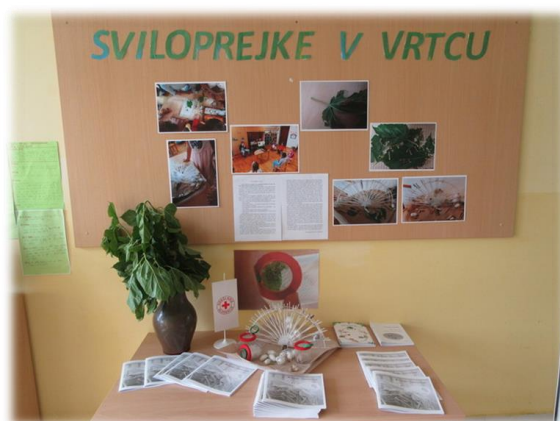
Razstava ob zaključku projekta, oktober 2020.