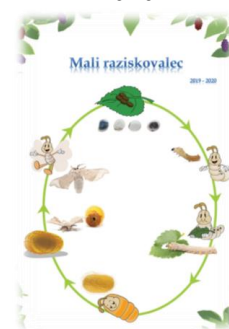
Naslovnica publikacije Mali raziskovalec 2019 – 2020

Poročilo pripravili: Maja Botolin Vaupotič