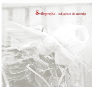
Naslovnica publikacije Sviloprejka – od jajčeca do metulja

Izdelava in razpošiljanje zaključnega poročila o delu medobčinske LAS v letu 2020.